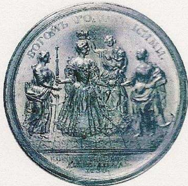
RUSSLAND. Anna 1730 - 1740. Goldmedaille zu 40 Dukaten 1730, signiert GFR, auf die Krönung der Zarin; bekröntes Brb. nach rechts/die stehende Kaiserin wird von der personifizierten Liebe gekrönt, links vor ihr die auf ein Kreuz gestützte Religio, die ein Zepter überreicht, rechts die Hoffnung mit Anker, die der Zarin den Reichsapfel übergibt. Sig. Michailowitsch 114 (dieses Ex.!) sowie Christie's, London 314, Sig. Reichel- vgl. 1688 (Silber). 61,7 mm, 138,30 g, kleine Kratzer, kleiner Stempelfehler. fast Stempelglanz.

Sichern Sie sich diesen Auktionskatalog, er wird gewiß auch später noch gesucht und zitiert werden!