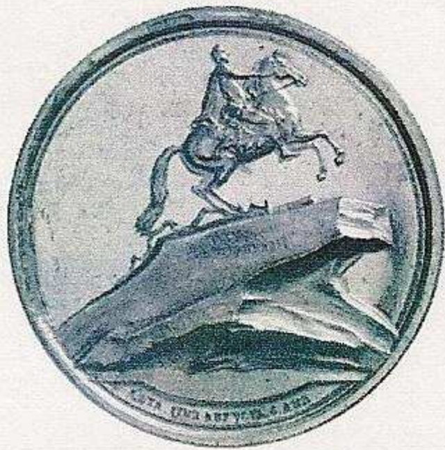
RUSSLAND. Katharina II., 1762 – 1796. Goldmedaille zu 22 ½ Dukaten 1782 von F. W. Gass auf die Errichtung des Reiterdenkmals für Peter den Großen; belorbeertes Brb. mit Andreas- und Georgsorden nach links/auf einem Felsen das Denkmal für Peter den Großen, der auf einem aufsteigendem Pferd sitzt. Sig. Michailowitsch 312 (dieses Ex.), Sig. Reichel-, vgl. 2670 (Silber). 54,4 mm, 77,98 g; kleiner Stempelfehler, vorzüglich. Taxe: 15 000,-