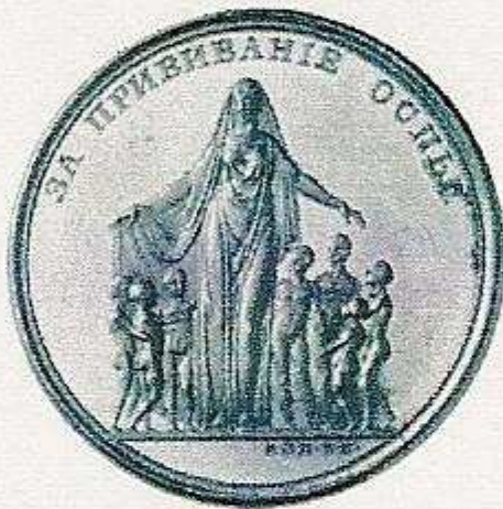
RUSSLAND. Katharina II., 1762 – 1796. Goldmedaille zu 10 Dukaten o. J. von Kop (?) für Verdienste bei der Pockenimpfung; gekröntes Brb. nach rechts/weiblicher Genius beim Beschützen von Kindern. Sig. Michailowitsch 321 (dieses Ex.), Sig. Reichel-, 38,90 mm, 34,48 g; fast Stempelglanz. Taxe: 7500,-