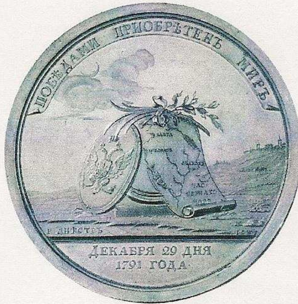
RUSSLAND. Katharina II., 1762 – 1796. Goldmedaillon zu 70 Dukaten 1791 von C. Leberecht und I. G. Waechter auf den Frieden mit dem Osmanischen Reich; bekröntes und belorbeertes Brb. nach rechts/russischer Wappenschild lehnt an Säulenschaft, an dem eine Karte herunterhängt mit den im Krieg eroberten Gebieten am Schwarzen Meer, im Hintergrund Wolken, rechts Festung oder Stadtanlage. Sig. Michailowitsch-, vgl. 319, sowie Christie's, London 343, Sig. Reichel-, vgl. 2835 (Silber). 83,20 mm, 236,95 g; vorzüglich-Stempelglanz. Taxe: 25 000,-