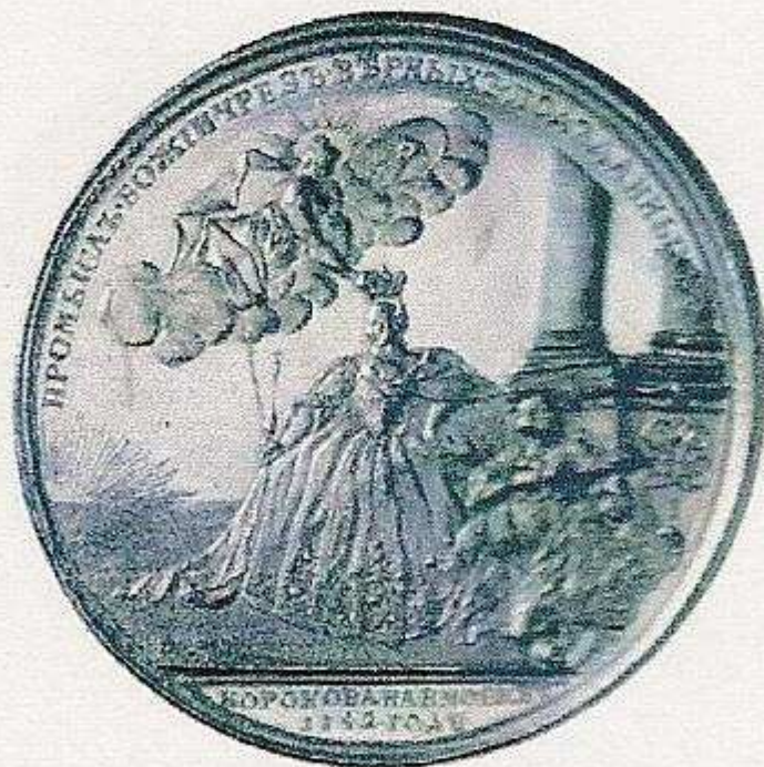
RUSSLAND. Anna 1730 - 1740. Goldmedaille zu 35 Dukaten 1742, unsigniert, auf ihre Krönung; bekröntes Brb. nach rechts/die Kaiserin wird von der aus Wolken schwebenden Vorsehung bekrönt und mit einem Schild beschützt, links im Hintergrund aufgehende Sonne, rechts zwei Säulenschäfte, worauf ihr Monogramm bzw. das Monogramm Peters des Großen angebracht ist. davor kniende Gestalt mit loderndem Herz und dem russischen Wappenschild in den Händen; Sig. Michailowitsch-, Sig. Reichel-, vgl. 1891 (Silber). 58,2 mm, 121,11 g; vorzüglich - Stempelglanz. Taxe: 15 000,-